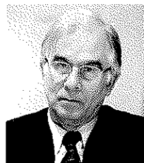
クリストフ・ヴォルフ Prof. Christoph Wolff

おさんの演奏するプログラムには、バッハの最初期のオルガン作品がいくつか含まれています(プレリュードとフーガ ホ長調 BWV566、アラ・ブレーヴェニ長調 BWV589、コラール・ファンタジー《キリストは死の縄目につながれたり》など)。これらの曲は、若きバッハの芸術的・技術的高さを立証するものです。それらと共に演奏されるトリオ・ソナタ、種々のコラール編曲、プレリュードとフーガは、それ以降の創作時期に作曲されました。そこからは、バッハのオルガン音楽のもつバラエティの豊かさと多面性が、よく見て取れることでしょう。