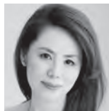
田部京子 ピアノ Kyoko Tabo

大阪音楽大学オルガン専攻を最優秀賞を得て首席で卒業。同大学音楽専攻科オルガン専攻修了。ドイツ・リュベック音楽大学大学院オルガン科修士課程を最高得点で修了。オルガンを土橋薫、アルフィート・ガストに師事。古楽をハンス・ユルゲン・シュノールに師事。ライブツィヒ第20回バッハ国際コンクールのオルガン部門にて日本人初となる第一位と聴衆賞を受賞。平成29年度「咲くやこの花賞(音楽部門)」(2017年12月)、「音楽クリティック賞(奨励賞)」(2018年1月)を受賞。ドキュメンタリー番組「情熱大陸」に出演。日本オルガニスト協会会員。YouTubeでオルガン作品を紹介する活動も行う。 http://kazukitomitaorg213.wixsite.com/home