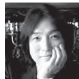
飯森範親 指揮 Norichika Iimori

17歳で日本音楽コンクール優勝。ベルリン芸術大学に学び、ミュンヘン国際音楽コンクール(ARD)など受賞多数。バイエルン放送響、バンベルク響、モスクワ・フィルとの共演他、世界のトップアーティストから厚い信頼を寄せられている。CDは30枚以上をリリース、その多くが国内外で特選盤に選出。大成功を収めているリサイタルシリーズは、2016年からスタートした「シュベルト・プラス」が好評を博している。2018年にCDデビュー 25周年を迎え、東京芸術劇場で一晩に2曲のピアノ協奏曲を演奏した他、全国各地でリサイタルを開催。第一線で演奏活動を続ける傍ら、桐朋学園大学院大学教授も務める。日本を代表する実力派ピアニストとしてますます人気を集めている。 オフィシャルHP: http://www.kyoko-tabo.com