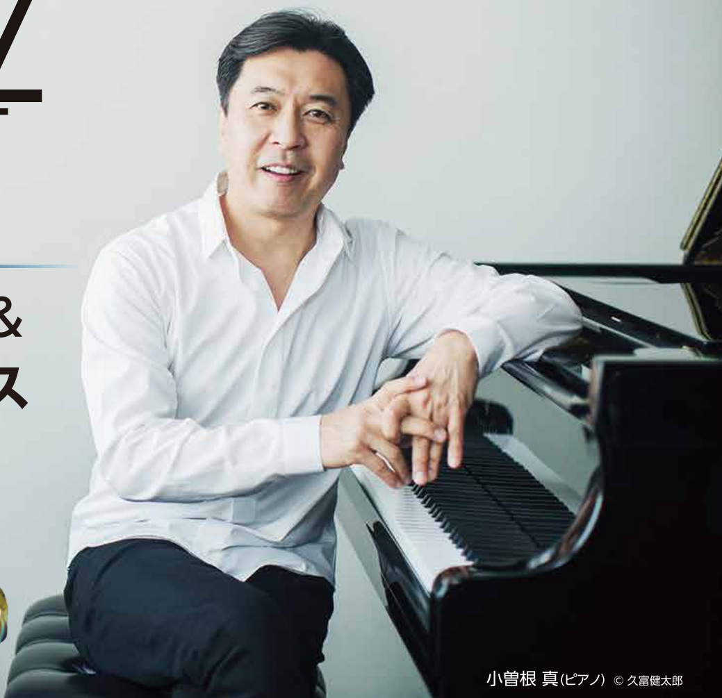
小曽根 真(ピアノ)